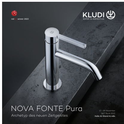
Beispiel Anzeige Broschüre 2022